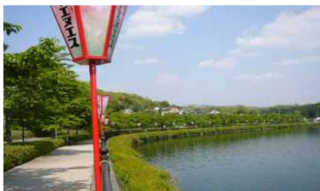
葉桜になりましたが、上野池の桜です。